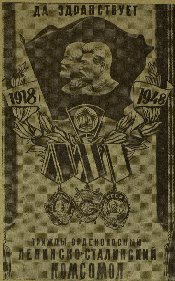
29 октября исполняется 30-летие ВЛКСМ. Плакат работы худ. И. Гафа, выпущенный издательством «Искусство», к памятной дате.